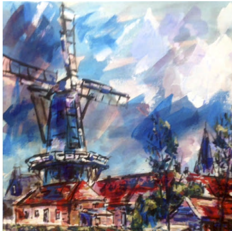
Molen De Hoop in Haren

Okel is sinds 1990 lid van de Groninger kunstkring De Ploeg.